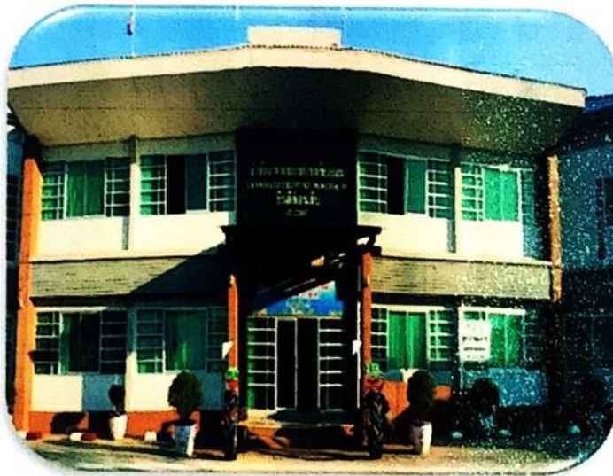
เทศบาลตำบลเชียงกลม อำเภอปากชม จังหวัดเลย